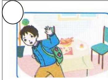
يَرْتَدِي مَنْرَرَهُ وَيَحْمِلُ مَحْفَظَتَهُ وَيَتَوَجَّهُ إِلَى الْمَدْرَسَةِ