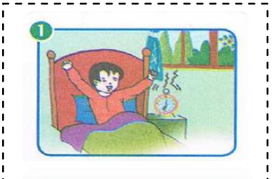
يَسْتَيْقِظُ عَلَيَّ مِنَ النَّوْمِ بَاكِراً