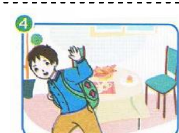
يَرْتَدِي مَنْرَرَهُ وَيَحْمِلُ مَحْفَظَتَهُ وَيَتَوَجَّهُ إِلَى الْمَدْرَسَةِ