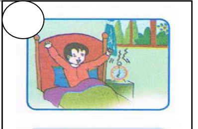
يَسْتَيْقِظُ عَلَيَّ مِنَ النَّوْمِ بَاكِراً