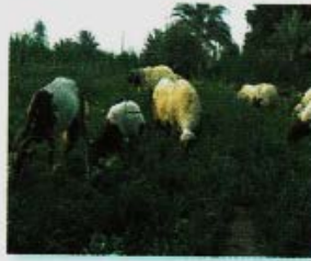
الأغنام في المريع .. تأكل الأعشاب ..