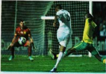
سدّد اللاعب الكرة .. نجو المرمي ..

• عَبِّرْ عَنِ الصَّوَرِ بِجُمَلٍ تَتَضَمَّنُ كَلِمَاتٍ تَنْتَهِي بِأَلْفٍ مَقْصُورَةٍ :