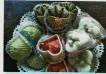
هذا الصحن مملوء .. .. بالحلوى ..