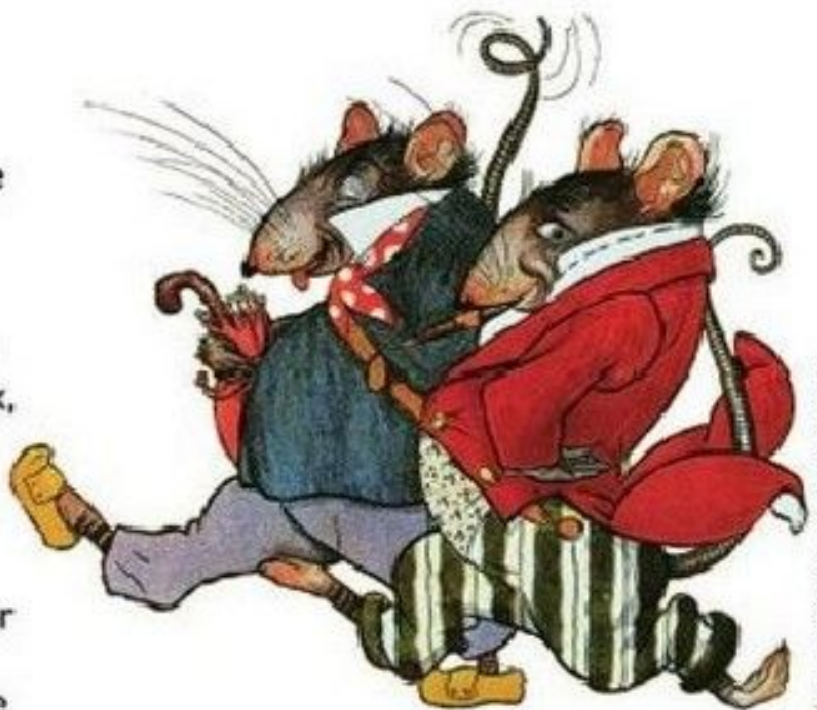
Le Rat des villes et le Rat des champs. par Félix Lortoux, XX e siècle

La raison du plus fort est toujours la meilleure... Le loup et l'agneau