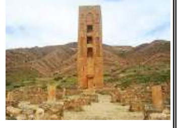
قلعة بني حماد - المسيلة -

السند 2: << يتعرض التراث في بلادنا لمظاهر الإهمال والنهب والتخريب.... >>