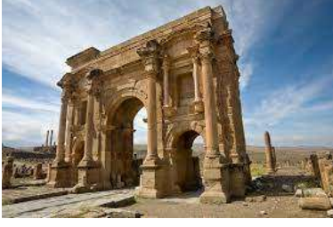
تيمقاد - باتنة -