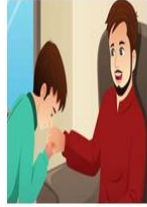
أحترم أبي وأُمِّي

اشير الى كلمة الوالدين في الآية واقول الوالدين هما الاب والام ثم اشير الى احسانا واقول يعني ان نعاملهما معاملة حسنة كيف نعاملهما ؟ ....معاملة حسنة (تكرار) (شرح المعاملة الحسنه من خلال الصور)