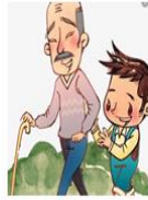
أعطي أبي عِدَّةَ كَثِيرٍ