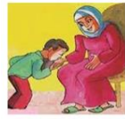
أُصَلِّحُ أُمِّي وَأَبِيَّ بِأَدَبٍ