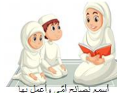
أُصَلِّحُ أُمِّي وَأَبِيَّ بِأَدَبٍ