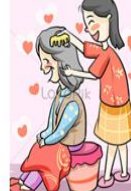
أعطي أُمِّي عِدَّةَ كَثِيرٍ