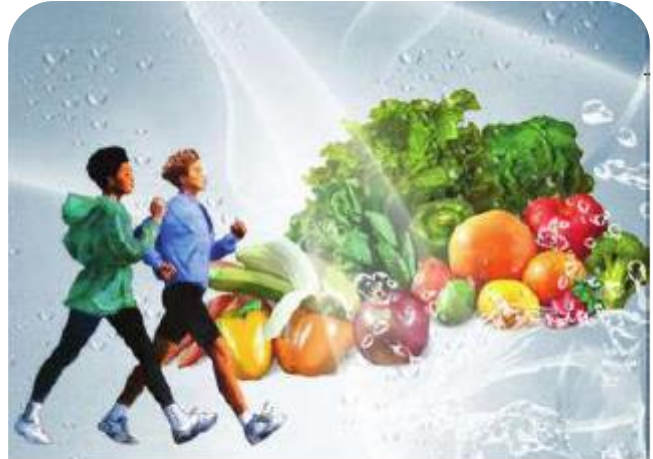
▲ التغذية والرياضة