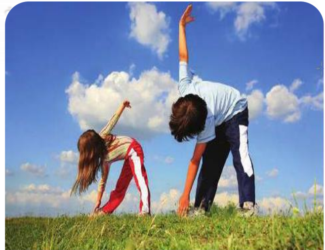
▲ رياضة في الهواء الطلق حفاظا على الصحة