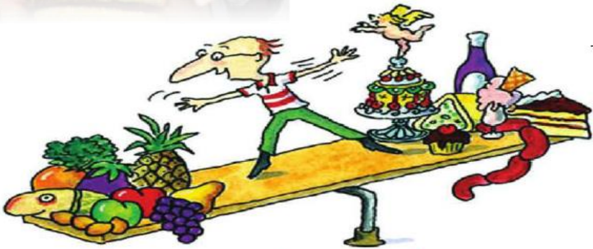
▲ رسم كاريكاتيري حول التوازن في التغذية