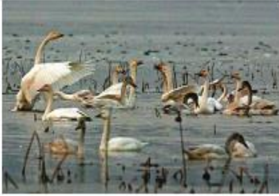
▲ طيور بالمحمية الطبيعة للفالة شرق الجزائر