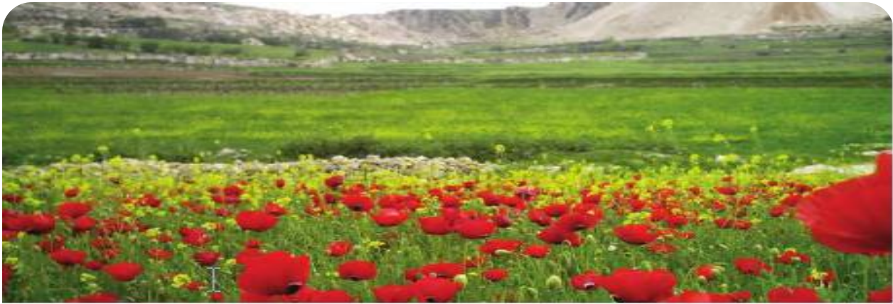
▲ منظر للورود الجميلة في فصل الربيع بولاية قالمة