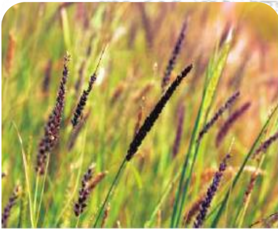
▲ تنوع الزرع