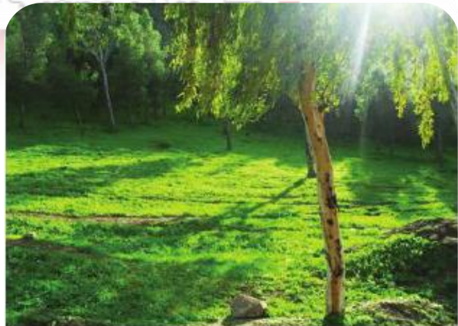
▲ صور الاخضرار في فصل الربيع ببلدية عمي موسى، ولاية غليزان